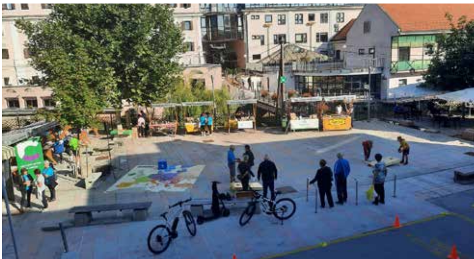
Pogled iz zraka na prizorišče.

V soboto, 16. septembra, je na ploščadi pred in za Kulturno kongresnim centrom Dolenjske Toplice potekala osrednja prireditev v okviru Evropskega tedna mobilnosti. Občina Dolenjske Toplice je skupaj s partnerji pripravila bogat animacijski program za vse generacije. Nekaj foto utrinkov iz arhiva občinske uprave.