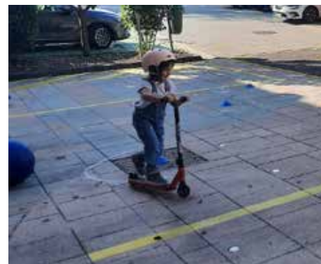
Najmlajši so uživali.