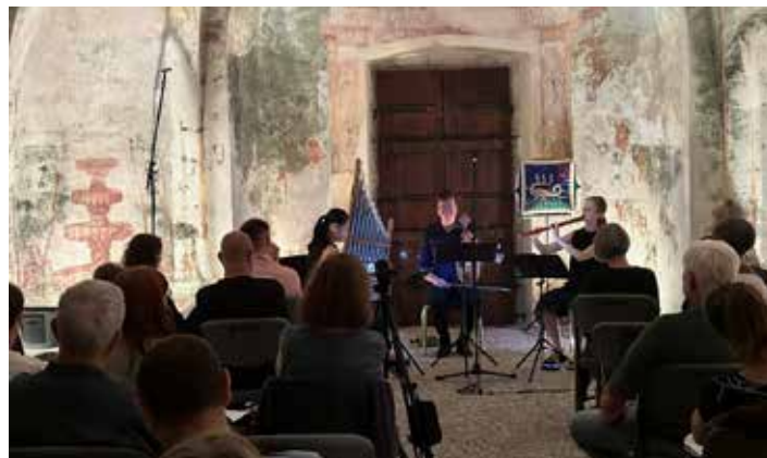
Do zadnjega kotička napolnjen Hudičev turn.

Festival Seviq Brežice je postal sinonim za živo glasbeno dediščino. V štiridesetih letih delovanja si je utrdil svoj ugled doma kot prireditel nacionalnega pomena in se uvrstil med najpomembnejše kulturne dogodke, v svetu pa si je ustvaril status odlične in visoko cenjene prireditve ter požel priznanja umetnikov, producentov, strokovne kritike, poslovnega sveta ter ljubiteljev glasbe. Na koncerte festivala Seviq Brežice vabijo zgolj najuglednejše umetnike, ki izvajajo vrhunski program najvišje kvalitete. Skozi različne programske sklope kompleksno predstavljajo evropsko in svetovno glasbeno zapuščino, pri čemer posvečajo še posebno pozornost izvajanju glasbe, ki je nastala na slovenskih tleh.