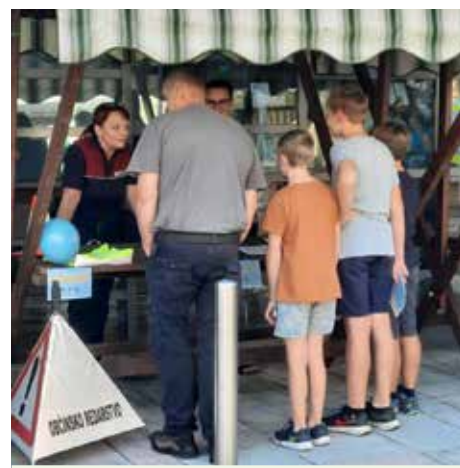
Predstavitve medobčinskega inšpektorata in redarstva.