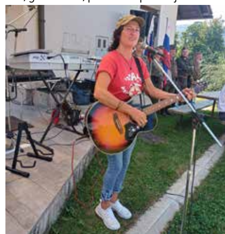
Marjetka je »vžigala«.