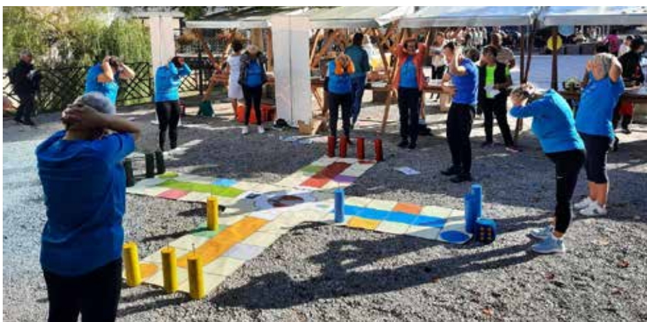
Manjkale niso niti velike družabne igre.