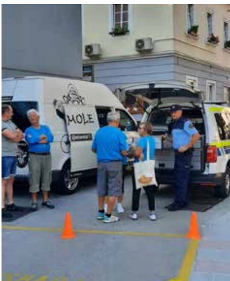
Predstavniki Policijske postaje Dolenjske Toplice