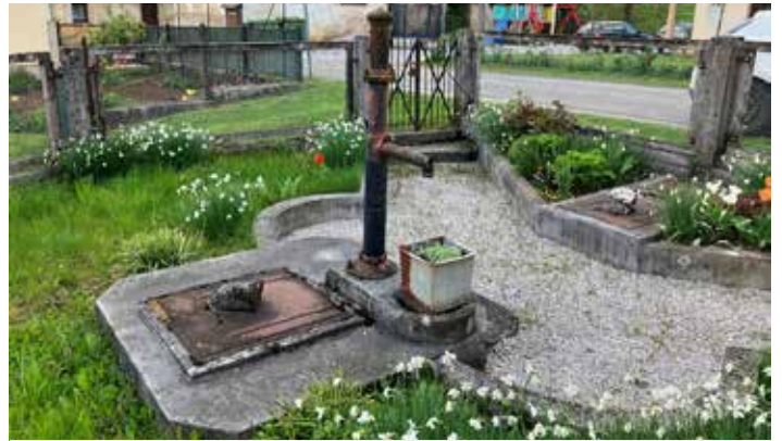
Fotografija je nastala spomladi.

Dobindol je eno izmed naselij naše občine. Sodeč po nemškem imenu Eichental se je krajevno ime razvilo iz Dobni dol , kar vsebuje pridevnik od dób (občnoimenski pomen za vrsto hrasta dob). Ime se je v rednem jezikovnem razvoju razvilo iz slovanske besede dobъ (v pomenu listnato drevo, hrast) in dól , manjša dolina. V starih listinah se v letih 1763–1787 kraj omenja kot Dobindo oder Eichental , Dobindol , Eichendol in Eichendorf . Pravi posebnost vasi je vaški betonski vodnjak talnega horizonta z litoželezno tlačno črpalko. Leta 1952 so jo na ograjenem platuju z jaškom za čiščenje vode in revizijskim jaškom zgradili vaščani po navodilih Zavoda