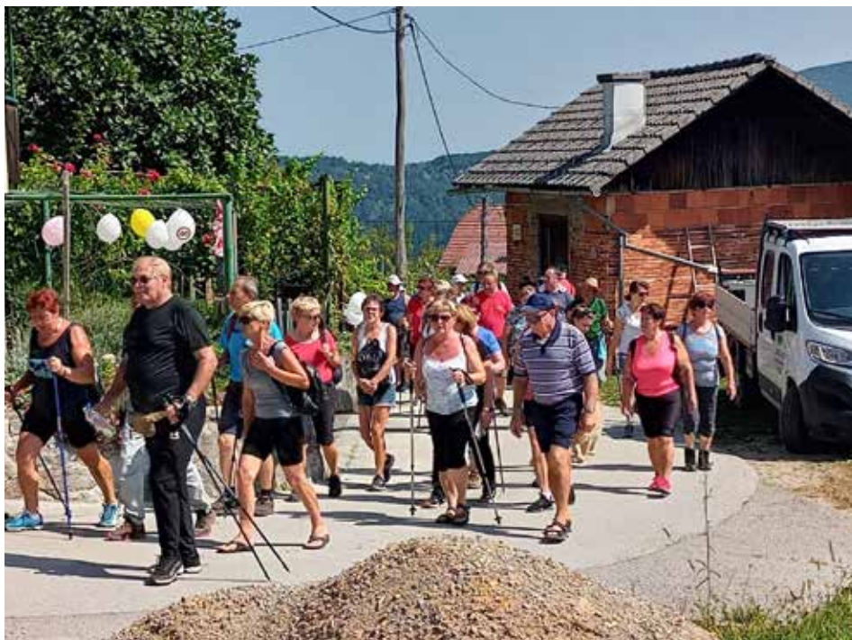
Pohodniki prihajajo na Rigelj.

Kočevju. Odločili so se, da bodo nastopili s delom, ki ga bo še treba napisati. Partizanski enodejanki sta napisala Edvard Kocbek – Noč pod hmeljnikom in Mile Klopčič – Mati. Klopčič je besedilo napisal v Podhosti, hišna številka 26. Obe sta bili uprizorjeni v Kočevju. Kocbekov poskus se ni več vrnil v spored partizanskih igralcev, medtem ko je Klopčičeva Mati doživela več uprizoritev. Tudi naš Vesel teater jo je pred leti uprizoril in z njo doživel velik odziv.