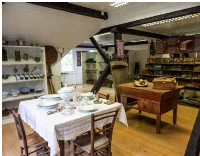
Utrinek z razstave.

Žigon (prevodi) in Primoža Primca (strokovni mentor). Poleg muzeja je sadovnjak starih sadnih sort. Gojenje sadja je bilo pomembno za prehrano in izdelavo pijače, hkrati pa je marsikateri kmečki družini predstavljalo vir dodatnega zaslužka. Na območju širše Kočevske uspevajo zlasti hruške in jabolane, pa tudi slive, cibore (ringlo) in češnje.