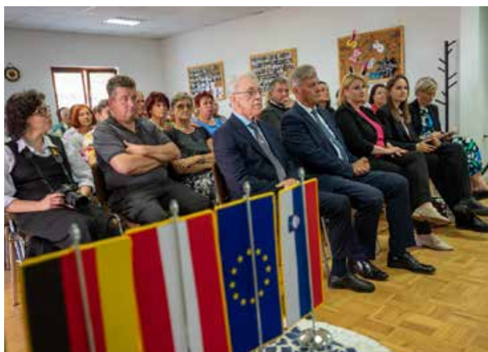
Dogodka so se udeležili predstavniki organizacij in ustanov iz Slovenije, Avstrije in Nemčije.