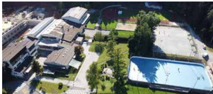
Osnovna šola Dolenjske Toplice Foto Miha Kranjc, avgust, 2023

Ob okrogli obletnici bi radi izboljšali tudi učno okolje, posodobili učilnice in jih opremili z didaktičnim materialom. Če nas morda želite podpreti tudi vi, nam sredstva lahko nakažete na transakcijski račun Osnovne